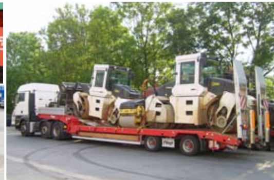
Verstärkter Jumbo-Satteltieflader für den LKW und Landmaschinentransport.