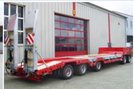
5-Achs-Anhänger-Tieflieder mit Radmulden und Nachlauf-Lenkachse.