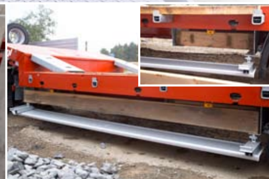
Staufach für Verbreiterungsholz seitlich.