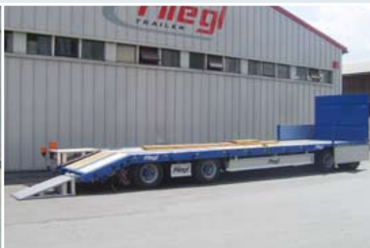
4-Achs-Anhänger-Tieflieder mit gerader Plattform und Alu-Klapprampen am Heck