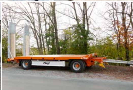
2-Achs-Anhänger-Tieflieder in kurzer Ausführung.