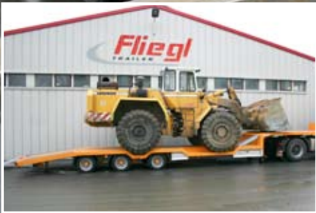
Tieflader mit überfahrbaren Radmulden. Hohe Nutzlast, durchdachte Detaillösungen – flexibel für jeden Einsatzzweck.