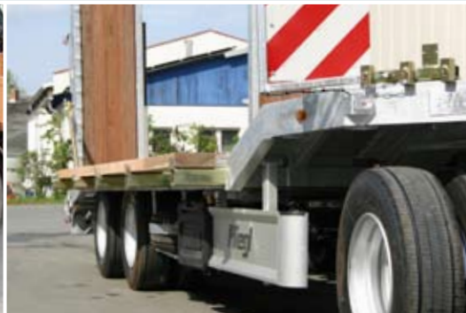
Teleskopierbare Verbreiterung auf ca. 3.000 mm Gesamtbreite.