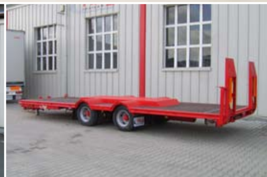
Tandem-Tieflader-Anhänger, speziell konstruiert für den Transport von landwirtschaftlichen Maschinen.