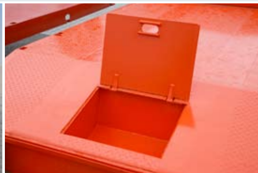
Staukasten in Kröpfung eingelassen (serienmäßig).