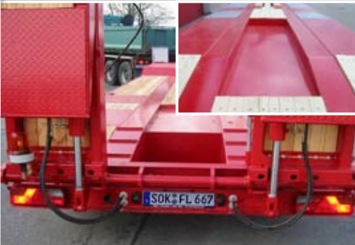
Löffelmulden nach Maß – Fliegl hat immer den passenden Tieflader.