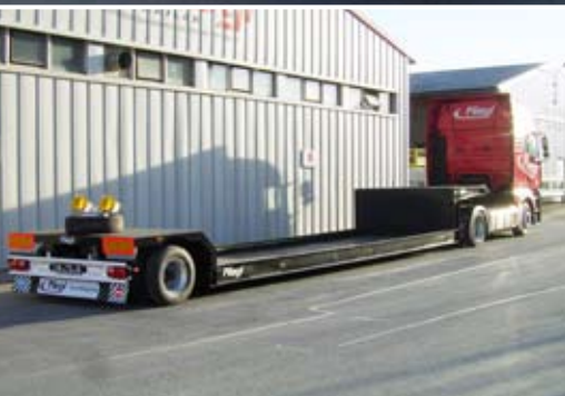
Nach Ihren Anforderungen: vom Tiefbett- Auflieger bis zum mehrachsigen Tieflader.