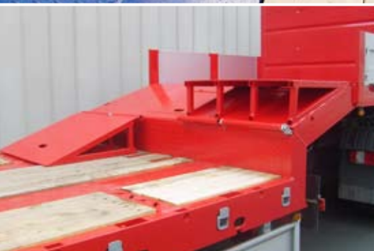
Klapprampe zur Überfahrt auf Schwanenhals