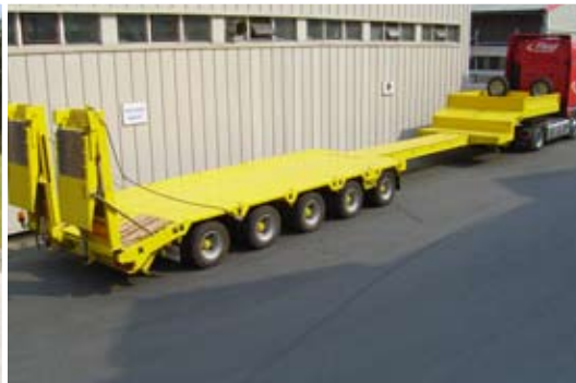
Teleskopierbare Satteltiefloader in unterschiedlichen Längen mit Achskonfigurationen Ihrer Wahl.