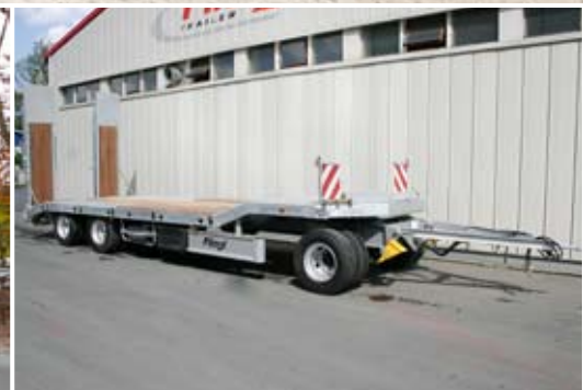
Tieflieder mit gekrüppter Ladefläche. Alle Fliegl Tieflieder auch feuerverzinkt für besten Schutz gegen Korrosion lieferbar.