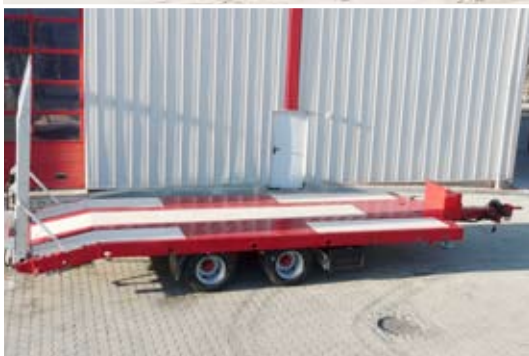
Tandem Anhänger für Baumaschinentransport, mit Walzenverlängerung vorne.