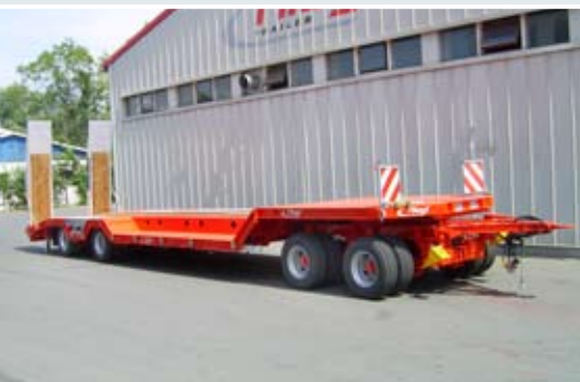
Tieflieder-Anhänger mit großer Radmulde.