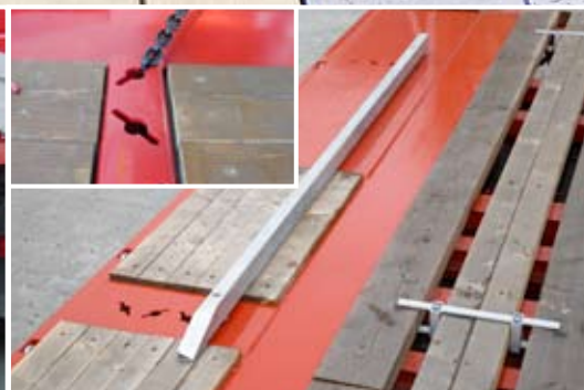
Längsführungsschienen. Schlüssellochprofile gleichzeitig für Ladungssicherung verwendbar. Staufach für Verbreiterungsholz mittig.