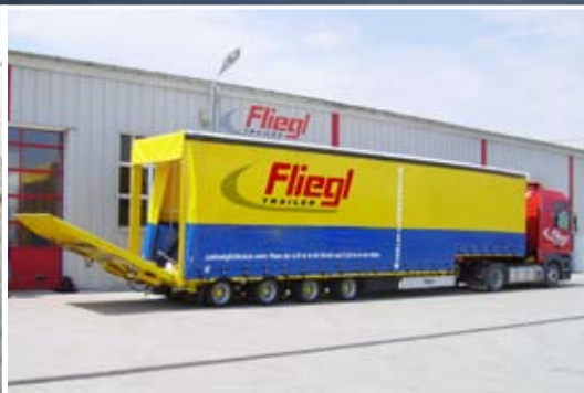
4-Achs-Planen-Satteltiefloader mit 3,50 m Innenhöhe und auf 4,00 m verbreiterbar.