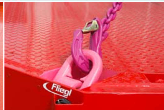
Sicher verzurrt mit RUD-Zurrösen.