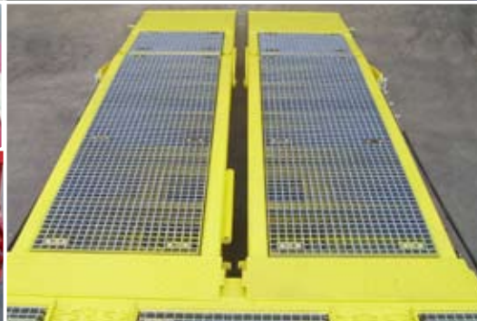
Rampen mit verzahntem Gitterrost belegt. Rampe geteilt und hydraulisch seitlich verschiebbar.