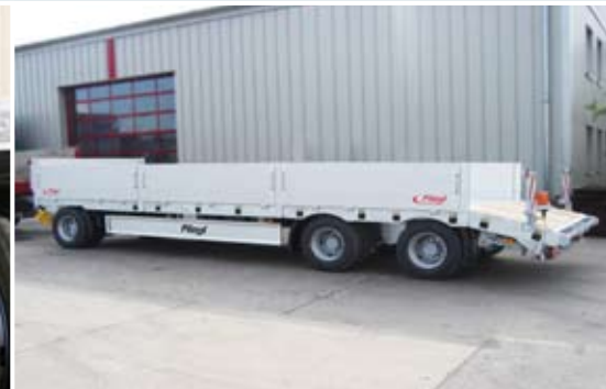
Tiefladeranhänger mit gerader Ladefläche und Bordwänden für universelle Einsätze.