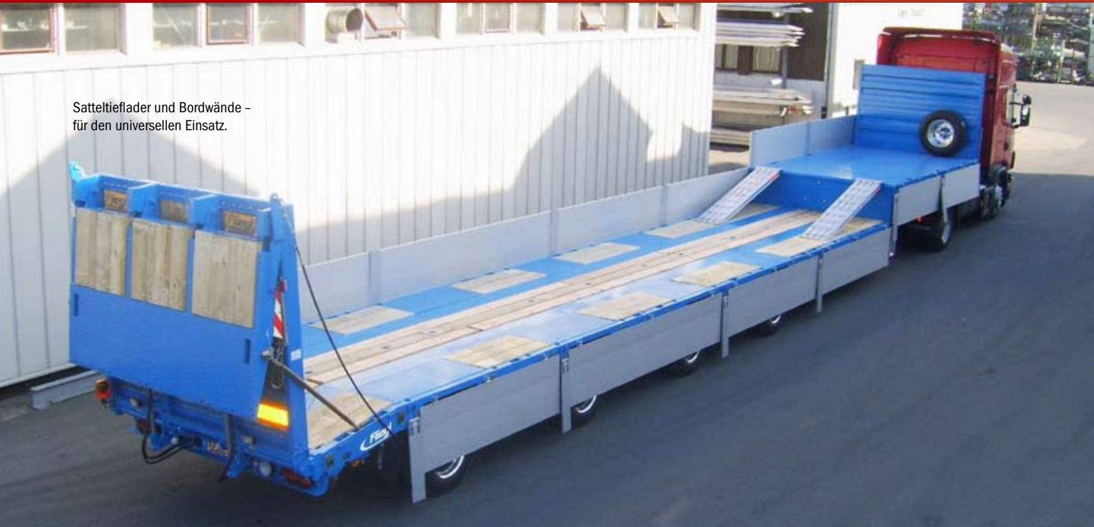
Satteltiefloader und Bordwände – für den universellen Einsatz.