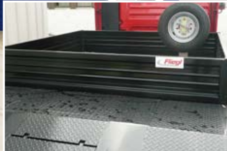
Bordwände auf dem Schwanenhals aus Stahl (steckbar).