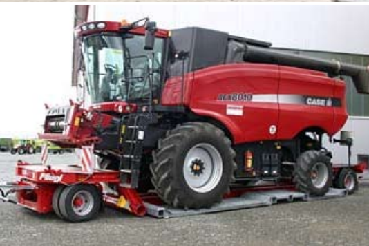
ZTS 200 Spezial, für Mähdrescher Transporte, Ladehöhe ca. 250 mm, abnehmbare Hinterachse zur nahezu ebenerdigen Beladung.