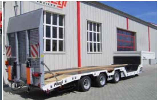
Satteltiefloader mit zwei Radmulden.