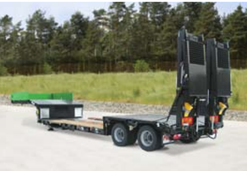
Tiefbett-Sattelaufleger mit geteilten Rampen.