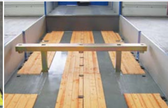
Ladeflächenausgleichsbock vom Schwanenhals zur Tiefladerfläche.