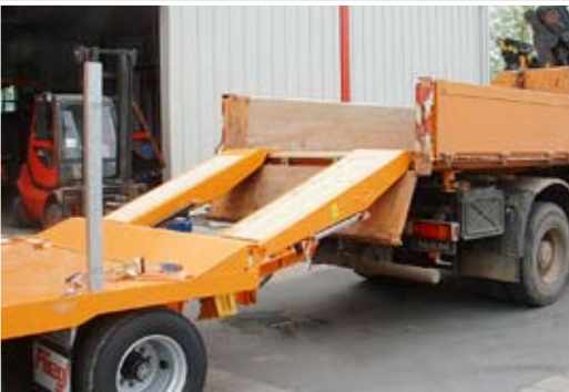
Mehr Nutzen für Sie: Überfahrrampen vom Tieflader-Anhänger auf das Zugfahrzeug.