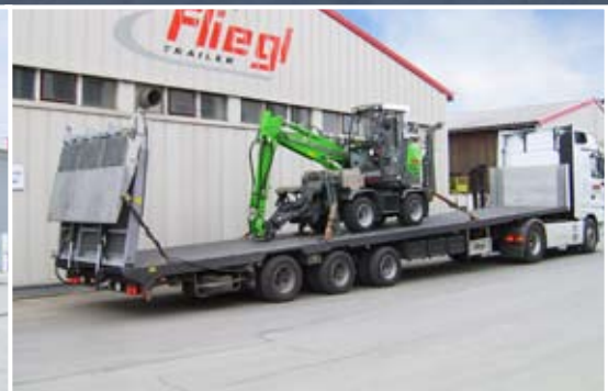
Schrägbett-Auflieger in verschiedensten Ausführungen z. B. mit durchgehender Rampe.